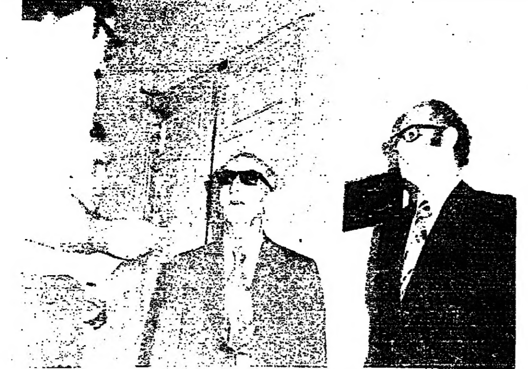
رئيس الحكومة العميد اول المقاعد نور الدين الرفاعي يتحدث الى الصحفيين في السراي ، ويدير المذكرة عمر مسكة الامين العام لمجلس الوزراء

الوزراء العسكريون ● ١٠٥٥ - وصل العميد الركن عيسى كنعان نائب رئيس مجلس وزراء وزير الاعمال والتمويل . ● ١١٢٥ - وصل العماد سميد الله وزير الداخلية والاسكان . ● ١١٢٥ - وصل القبط السابق وزير الدفاع جبريل الذي هنأه وزير الدفاع السابق . ● ١١٢٥ - غادر العميد الركن عيسى كنعان القصر الجمهوري بعد اارة الامم وجرى معه في باحة القصر الحوار التالي : ● عمالي الوزير ؟ □ شرفونا شرفونا على الوزارة . ● عمالي الوزير ؟ □ شرفونا شرفونا على الوزارة . ● عمالي الوزير ؟ □ شرفونا شرفونا على الوزارة . ● عمالي الوزير ؟ □ شرفونا شرفونا على الوزارة .